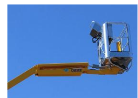
Fly jib (opsiyonel)